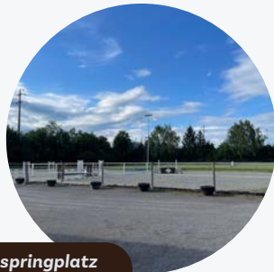
Sandspringplatz 30 x 60 m