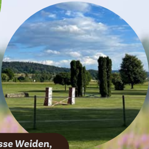
Grosse Weiden, Wiesenspringplatz